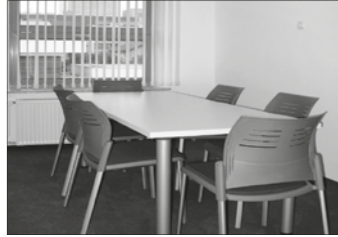
mala sejna soba