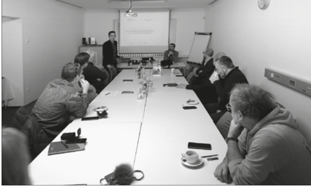
predstavitve ponudbe Primorske hranilnice Vipava na letošnjem prvem podjetniškem zajtrku na naši zbornici